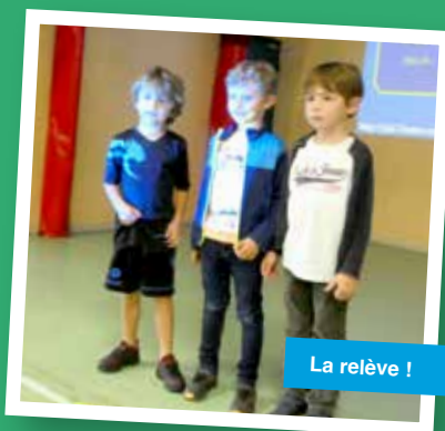
La relève !

Suit la Soirée Accueil : La salle se remplit peu à peu, parents et enfants prennent place.