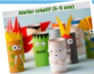
Atelier créatif (6-9 ans)